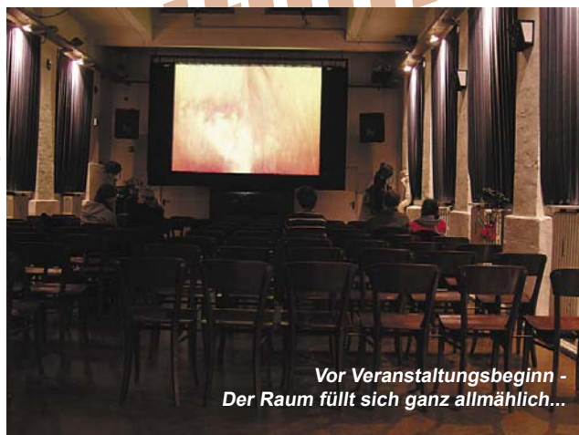
Vor Veranstaltungsbeginn - Der Raum füllt sich ganz allmählich...