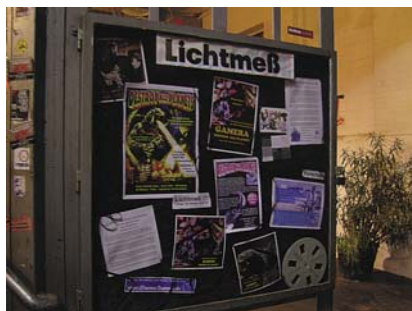
Leuchtreklame und Schaukasten des „Lichtmeß-Kinos“.

Besucher fanden den Weg in die „heiligen Hallen“ des „Lichtmeß-Kinos“. Hinzu kam, dass ich diesen Filmabend auf einen Freitag gelegt und eine Menge kulturelles Konkurrenzprogramm hatte. Dennoch hatten die Besucher und ich ihren Spaß.