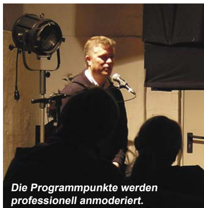
Die Programmpunkte werden professionell anmoderiert.

Zu Beginn stellte ich den privaten Japan-Film vor, der einen Reisebericht enthielt, dessen Strecke von Kobe, über Osaka, Kyoto, Hakone, Nagoya, Shizuoka und Tokio nach Yokohama führte. Viel kulturelles und wunderbare Aufnahmen waren zu sehen. Ein toller Film mit Unterhaltungswert, da die Erzählerin mit monotoner Stimme den Reisebericht kommentierte, was an einigen Stellen zu Heiterkeitsstürmen führte. Gute 35 Minuten dauerte diese 180 Meter, bis zum Rand gefüllte Filmrolle. Danach gab es eine kleine Pause von 10 Minuten, bevor ich die Einleitung zu dem Monsterfilm machte. Hierbei ging ich auf den Ursprung der japanischen Monsterfilme von Godzilla und Co. ein, sowie zum Film und dem Monster Gamera selbst, das ja der Freund aller Kinder ist, wo-